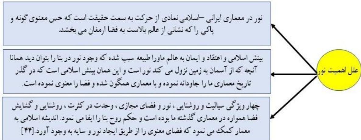
شکل ۲- بررسی علل اهمیت نور

معماران ایرانی به نور و اثرات آن از جهات مختلف دقت نظر و توجه داشته اند که در جریان تاثیرات معماری اسلامی به حد اعلی خود رسیده است، مواردی نظیر: توجه به بعد معنوی و تقدس نور، تعدیل نور در فضا و یکنواختی آن، امکان کنترل دید از داخل به خارج و برعکس و حفظ حریم همسایگان، رعایت بهداشت چشم و جلوگیری از خیرگی و چشم زدگی در هنگام ورود و خروج از فضای روشن به تاریک و بالعکس، توجه به بهداشت روانی و استفاده از نور متناسب با کاربری فضا و همین طور به کارگیری شیشه های رنگی برای زیباسازی و شاداب کردن فضای داخلی.