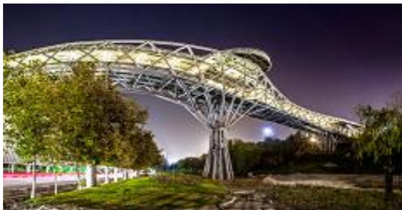
شکل ۳- چشم انداز پل طبیعت تهران