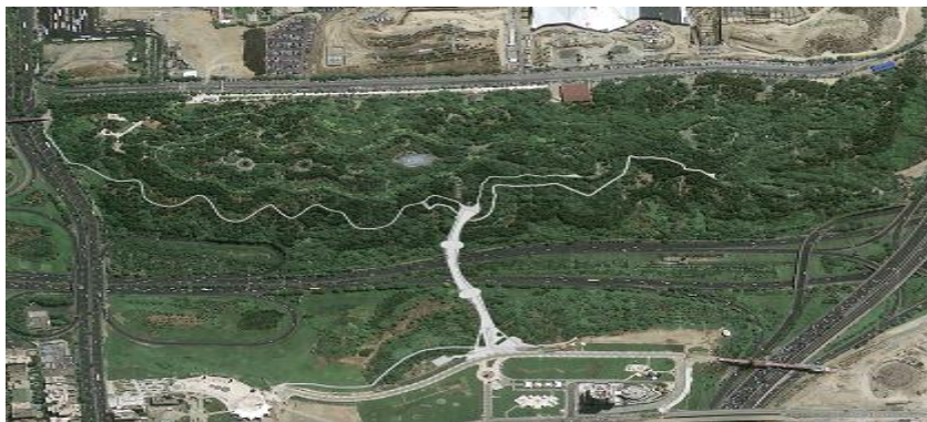
شکل ۲- موقعیت پل طبیعت تهران