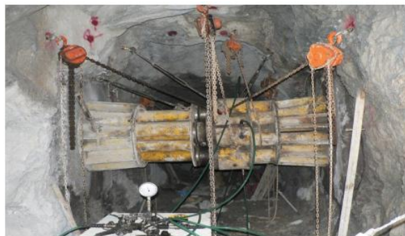
شکل ۳- نحوه اجرای آزمایش بارگذاری صفحه ای در گالری های اکتشافی ساختگاه سد چم شیر (مهتاب قدس، ۱۳۹۰)

انجام آزمایش بارگذاری صفحه ای در داخل گالری با بارگذاری از طریق یک جفت صفحه دایره ای شکل صلب یا انعطاف پذیر بر روی سطوح متقابل دیواره گالری صورت می گیرد.