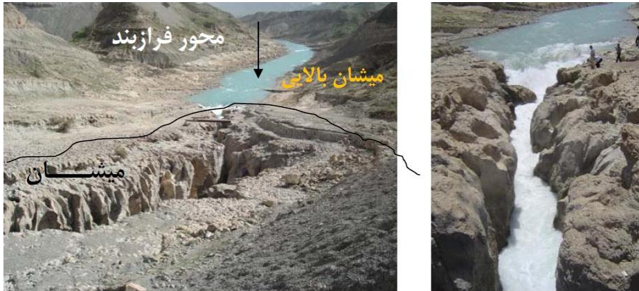
شکل ۲- موقعیت آبشار چم شیر در ورود رودخانه زهره به سنگ آهک های میشان میانی (مهتاب قدس، ۱۳۹۰)

باعث میشود تا ساختگاه سد از دو بخش تشکیل شود. به طوری که بخش پایینی آن از یک دره U شکل با دیواره های قائم تشکیل شده و بخش بالایی آن باز با شیب توپوگرافی ۳۴ درجه در جناح راست و ۳۶ درجه در تکیه گاه چپ است (شکل ۲).